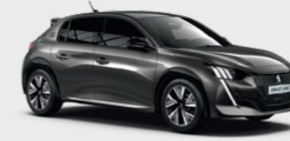
Platinum Grey** رمادي بلاتيني**