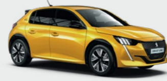
Faro Yellow** أصفر فارو**