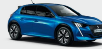
Vertigo Blue*** أزرق فيرتيجو***