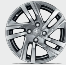
16" TAKSIM (Active Version). تكسيم 16 بوصة (طرار Active).