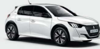
Banquise White* أبيض بانكيز*

تتميز بيجو 208 الجديدة بألوان هيكلها المثيرة! اختر من بين مجموعة الألوان الأساسية والحيوية، أو اختر شيئاً أكثر هدوءاً وأناقة.