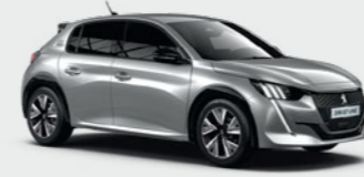
Artense Grey** رمادي أرتينس**