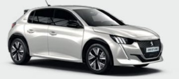
Pearl White**** أبيض لؤلؤي****

*Non-metallic colour **Metallic colour ***Three-layer with clearcoat ****Pearlescent colour