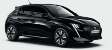
Perla Black Nera** أسود بيرلا نيرا**