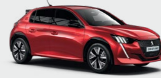
Elixir Red*** أحمر إكسير***