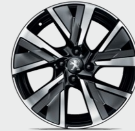
17" CAMDEN (GT Version). كامدن 17 بوصة (طرار GT).